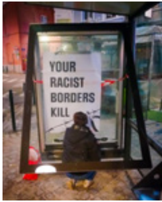
Action affichage à Bruxelles pour la campagne Abolish Frontex

bution néerlandaise à Frontex. Le ministère de la défense, le ministère de la justice et le ministère des affaires étrangères ont vu diverses actions se dérouler. La manifestation s'est terminée dans les bureaux de l'organisation néerlandaise de lobbying pour l'armement NIDV, où les militants ont distribué des actions d'Airbus montrant le coût réel des activités de l'entreprise.