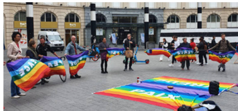
Rassemblement contre la guerre en Ukraine devant la Gare centrale à Bruxelles.