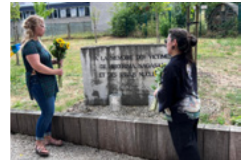
Commémoration Hiroshima le 6 août 2022.

Les États dotés d'armes nucléaires continuent de dépenser des milliards pour renouveler et étendre leurs arsenaux.