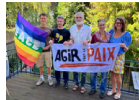
L'équipe permanente et le président d'A.P.L.P