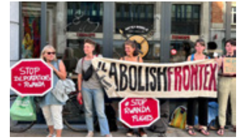
Rassemblement devant l'ambassade britannique contre le « Plan Rwanda ».

Abolish Frontex a organisé un rassemblement devant l'ambassade du Royaume-Uni en Belgique (Bruxelles) afin de protester contre les tentatives de déportations de plusieurs demandeurs d'asile vers le Rwanda.