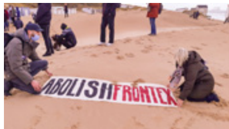
Action commémoration à Calais

« Commémoration nécessaire : nous ne pouvons laisser tomber dans l'oubli ces tragédies, nous devons regarder en face les responsables de ces morts et disparitions: l'UE et les Etats membres qui n'ont cessé de renforcer les frontières. Les frontières créent les passeurs. Les frontières tuent.